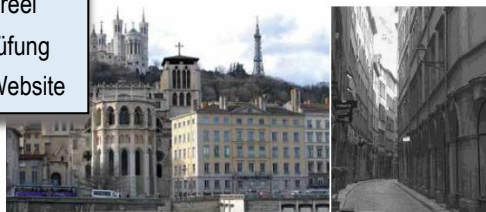
Cathédrale St Jean et basilique ND de Fournière